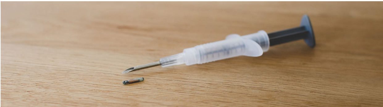
So sieht er aus, der etwa reiskorngroße Transponder.