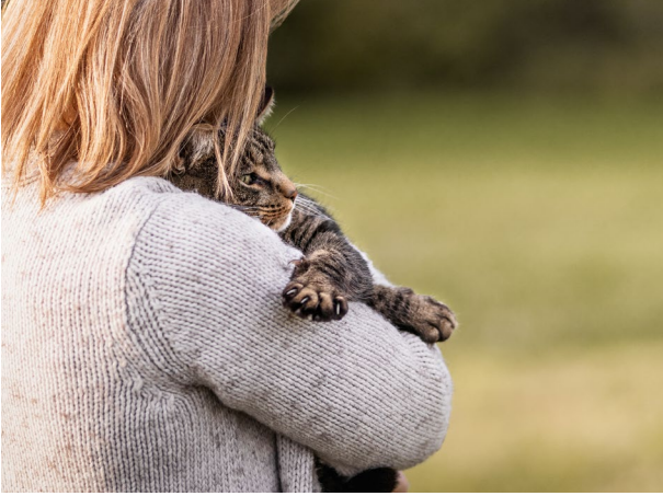
Wiedervereinigung von Katze und Halterin

Das TASSO-Logo, diese und weitere Pressefotos können unter presse@tasso.net auch in anderen Datenformaten und in Druckauflösung angefragt werden.