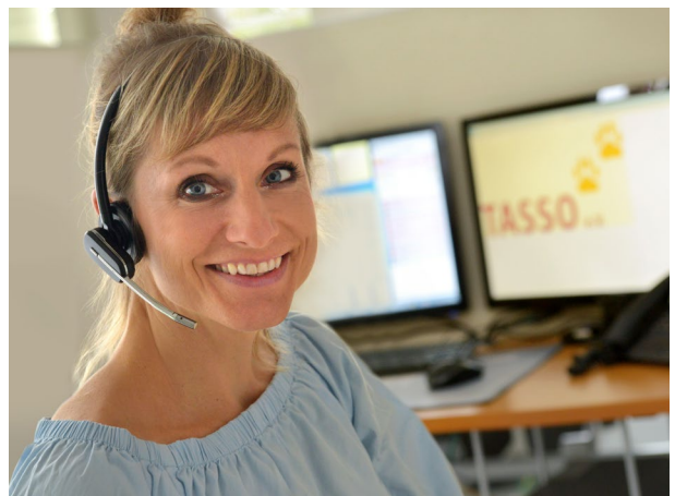
Mitarbeiterin in der TASSO-Notrufzentrale