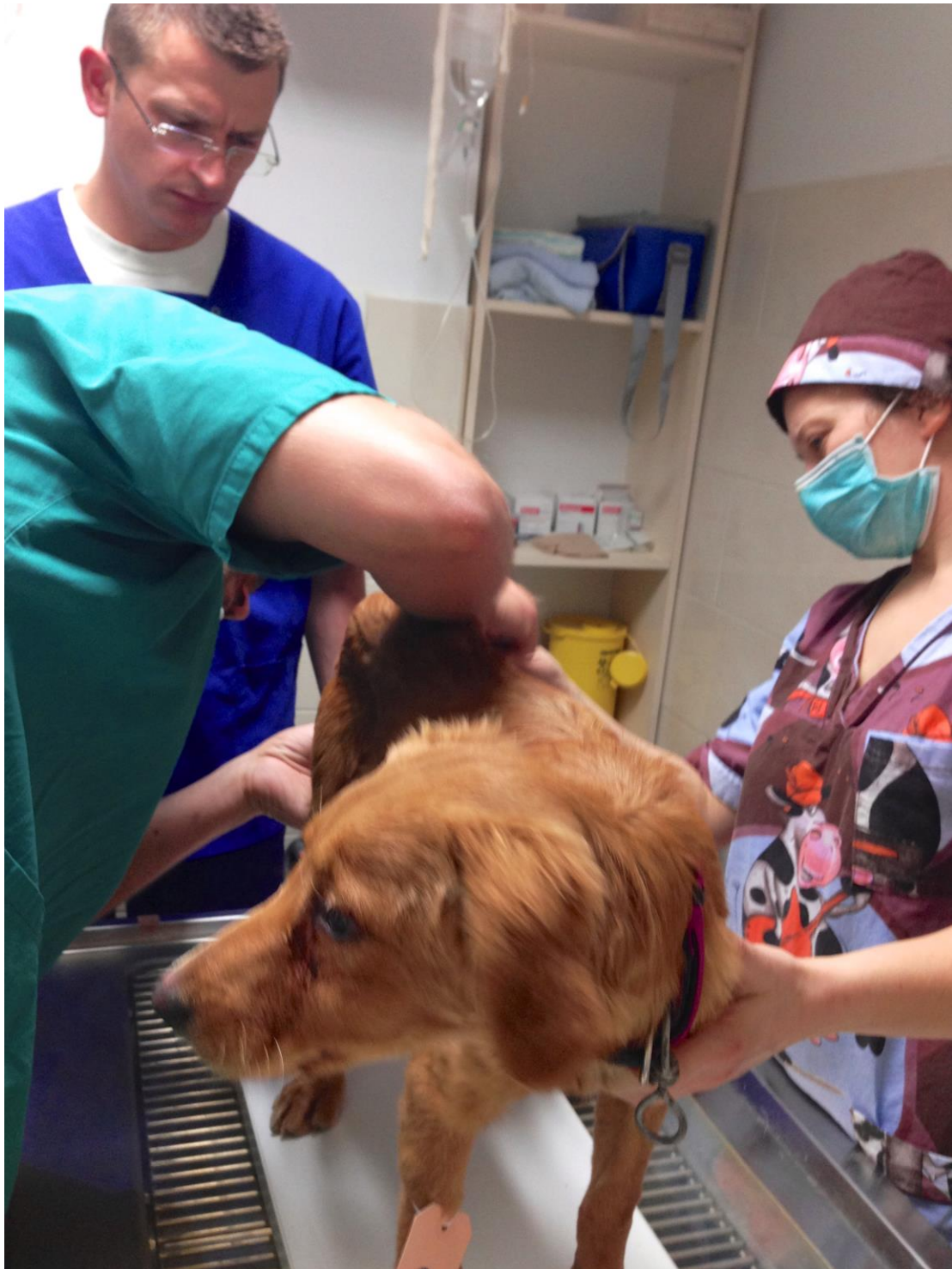
Ein schwer an Staupe erkrankter Straßenhund in Podgorica.

Bei meinem nächsten Projekt werde ich also nicht nur eine Tollwutimpfung und Parasitenbehandlung, sondern auch eine Staupe-Immunsierung in die Wege leiten. Das bedeutet allerdings um ein Mal mehr höhere Kosten, mehr Spenden, die wir brauchen, um solches Tierleid für die Zukunft zu vermeiden.